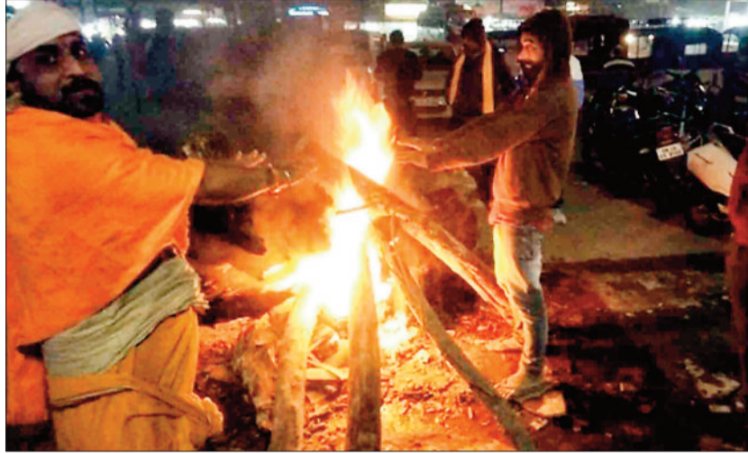
अलाव तापते लोग।

सूरगुजा में पिछले आठ दिनों से शीतलहर चल रही है संभाग मुख्यालय अंबिकापुर का पारा 5.0 डिग्री सेल्सियस के निकट रह रहा है तथा तापमान लगातार सामान्य से 4.5 डिग्री के नीचे रह रहा है। शहरी क्षेत्रों की तुलना में पठारी क्षेत्रों में शीतलहर का प्रभाव अधिक पड़ रहा है इन क्षेत्रों में सुबह ओस की बूंदें जमकर बर्फ में बदल जा रही है ठंड के लिहाज से सरगुजा संभाग छत्तीसगढ़ का सर्वाधिक शुष्क इलाका बना हुआ है। शुष्क हवाओं के प्रभाव से इसके पूर्व मैनपाट का पारा 4 से 5.4 डिग्री सेल्सियस के मध्य रह रहा था लेकिन शुक्रवार को देर शाम तक