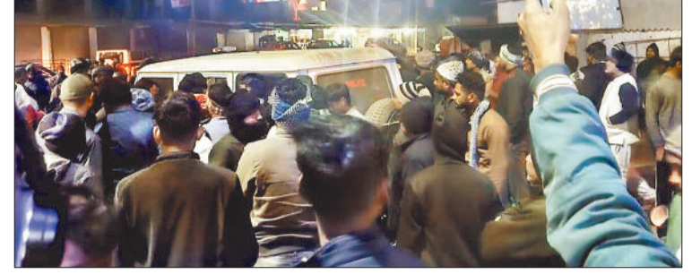
घटनास्थल पर लगी भीड़।

सके। हालांकि अभियान के बीच चरचा क्षेत्र के बस स्टैंड एवं रेलवे स्टेशन के आसपास आवारा कुत्तों की बढ़ती संख्या को लेकर गंभीर सवाल खड़े हो गए हैं। स्थानीय लोगों का कहना है कि उक्त क्षेत्र में काफी संख्या में आवारा कुत्ते जमा रहते हैं, जहां प्रतिदिन सैकड़ों यात्री, महिलाएं, बुजुर्ग और छोटे-छोटे