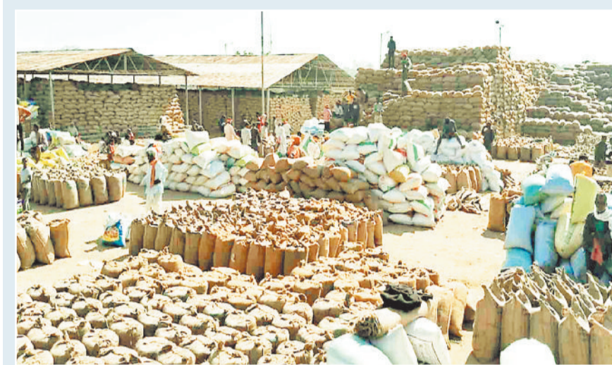
सूरजपुर धान खरीदी केंद्र।