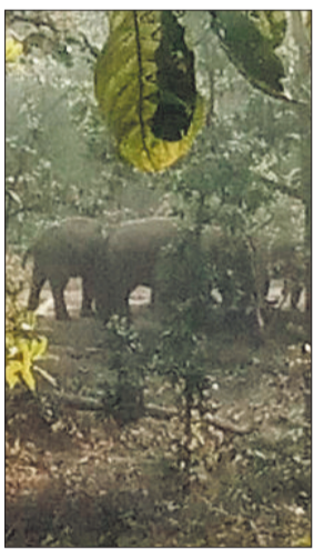
विचरण करते हाथी।

हाथियों के दल द्वारा इसके पूर्व रात्रि में कोटाडोल क्षेत्र के बरेल, दाब ग्राम में गेहूं के फसल को नुकसान पहुंचाया, इसके अलावा कई किसानों के खलिहान में रखे गए धान को खाकर नुकसान पहुंचाया। हाथियों के दल ने ग्राम केसोडा में दो ग्रामीणों के केले के पौधे को उखाड़कर खा गए। इस क्षेत्र से निकलकर हाथियों का दल वन परिक्षेत्र बहरासी परिसर बड़वार में प्रवेश कर गए। हाथियों का दल 14 दिसंबर को कक्ष क्रमांक पी 1120,