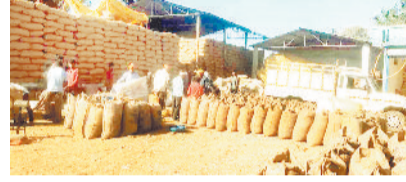
किसान कई दिनों से केंद्रों के चक्कर लगा रहे हैं, लेकिन संतोषजनक जवाब नहीं मिल पा रहा। किसानों का कहना है कि पिछले एक सप्ताह से लगातार प्रयास के बावजूद उन्हें कोई टोकन नहीं मिला। किसानों का आरोप है कि निगम से अधिक तौल, किसानों से अतिरिक्त धान लिया जा रहा।

रामानुजगंज। धान उपार्जन केंद्रों में समर्थन मूल्य पर धान खरीदी जारी है, लेकिन गणेशपुर एवं डिबिन्दा के खरीदी केंद्रों में अव्यवस्थाओं का बोलबाला है। किसानों की भारी भीड़ के बीच सबसे बड़ी समस्या अतिरिक्त तौल और अवैध वसूली बन बन गया है जिससे किसान बेहद परेशान हैं। किसानों का कहना है कि धान खरीदी केंद्र में भारी अव्यवस्था है। परिणामस्वरूप खरीदी की रफ्तार बहुत धीमी हो गई है और यदि स्थिति ऐसी ही बनी रहती तो आने वाले दिनों में कई समितियों में खरीदी ठप होने की आशंका है। टोकन के अभाव में किसानों की परेशानी और बढ़ी है। टोकन तू हट्ट ऐप से ऑनलाइन टोकन उपलब्ध नहीं है और ऑफलाइन टोकन भी जारी नहीं किए जा रहे। ऐसे में कई